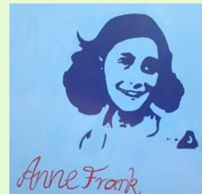
Außenwandgestaltung, BK-AG, 2015

Wir haben an unserer Schule eine eigene Schulsozialarbeiterin, Frau Dengler, die sich den ganzen Schultag um die Kinder und Eltern an der Schule kümmert, wenn sie Hilfe benötigen.